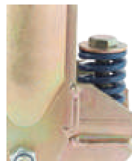
Muelle de compresión en disposición vertical con recorrido útil hasta 22 m/m.