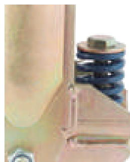
Muelle de compresión en disposición vertical con recorrido útil hasta 22 m/m.